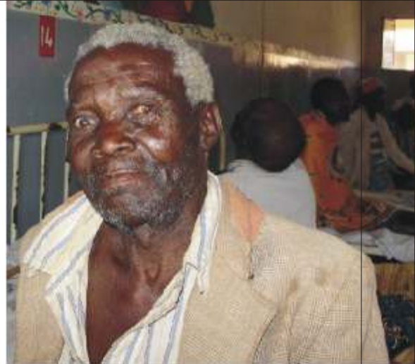
Ek kan weer sien!

Met brille kan daar 'n groot diens gelewer word. Die Oog-uitreikspan probeer om