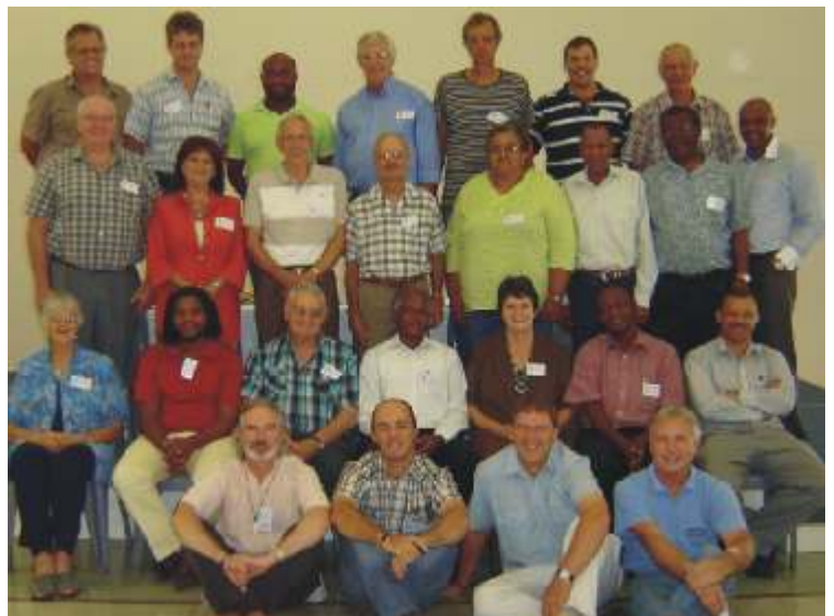
IMSA board and regional members at the National Conference

We experience these new developments to proclaim the Gospel at work, to assist employees, to assist those who lost their jobs, to help assess the levels of morality at the workplaces of people and the programs for congregational equipment and involvement (e.g. L.10.T.), in partnership with others, as good news . The developed programs and material will be branded and packaged as