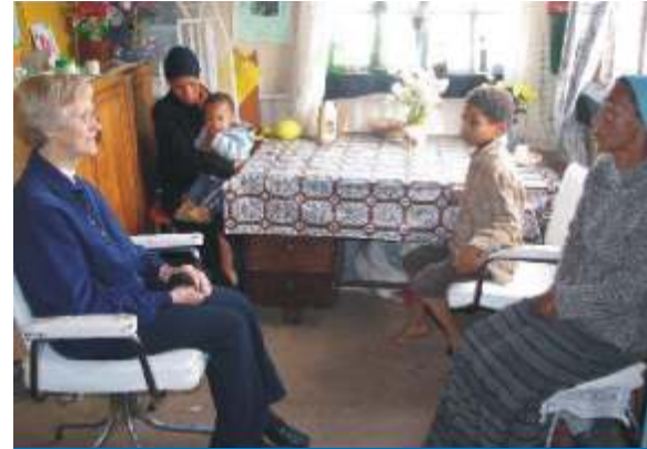
Besoek word gebring aan Christene met 'n Moslem-agtergrond.

onder andere op 'n informele manier kan bydra tot hulle toerusting. Hy tree ook dikwels op uitnodiging in verskeie gemeentes in die Wes-Kaap op, en doseer (ook op uitnodiging) 'n module aan die Teologiese Kweekskool op Stellenbosch oor die drie wêreldgodsdienste, Islam, Hinduïsme en Boeddhisme.