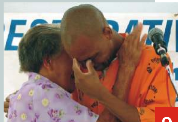
Herstel en versoening

Kontak hulle gerus by lucia.oos@mweb.co.za of 083 460 3775 indien jy graag meer wil weet of betrokke wil raak by hierdie bediening.