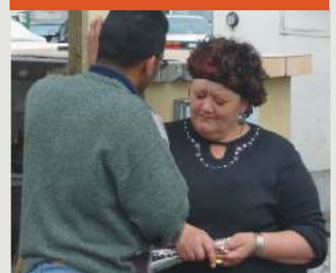
L.10.T. in aksie in Kalkbaai

Dit is 'n evangeliesasiestyl waarmee ons, wat dit gebruik, op 'n nuwe lewenstyl van diensbaarheid fokus; 'n bereidheid om te luister en te dien, eerder as om voor te skryf en te oortuig.