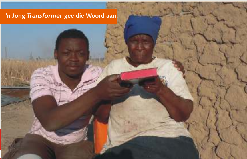
'n Jong Transformer gee die Woord aan.

In die lig van bogenoemde vennootskapswerk nooi ons graag die res van die huisgesin van God uit om by ons broers en susters in Msinga betrokke te raak en betrokke te bly. Dankie aan Hayfield-gemeente wat onlangs hierin by ons aangesluit het.