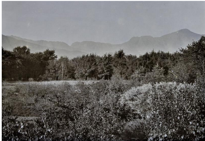
Die uitsig vanaf die stoep van Clairvaux, die pastorie in Wellington waar Dr. Andrew Murray geleef en gebid het

Dr. Murray skryf dat Jesus volgelingen tog seker glo dat God dit so bepaal het dat die koms van God se koninkryk, afhang van die gebede van sy kinders. Hulle gebede is van groot krag in die hemel, argumenteer hy, om die seëninge van die koninkryk, die werking van die Heilige Gees op die aarde te laat neerdaal. Dink hieraan, skryf Dr. Murray: “My gebed kan help om die koninkryk met krag te laat kom waar alles nog koud en dood is.” Is dit nie waarvoor ons as kerk van Christus aan die begin van 2021 geroep word nie?