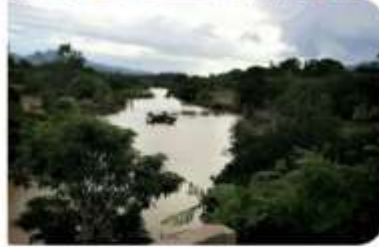
People are passing by lakana