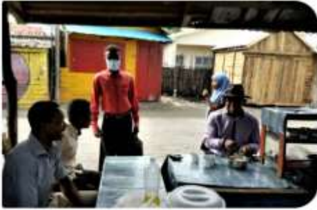
Coffee time before training