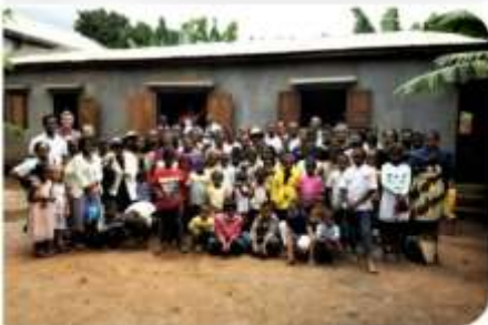
Ambatondrazaka church. Asking training on evangelism and church planting