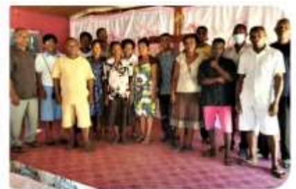
Morondava training ended

Morondava is aan die weskus van die eiland waar ons vir baie jare opleiding gedoen het. Daar word gereeld opvolg gedoen en hulle reik al uit na die omliggende gebiede.