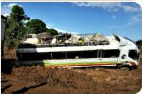
Road to fort dauphin. There was bridge broken. Thank god we could pass